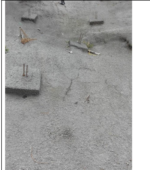
Foto 3. El ítem “3.2 Concreto lanzado reforzado con fibras de acero”, presenta fisuras en algunos sectores de la superficie.