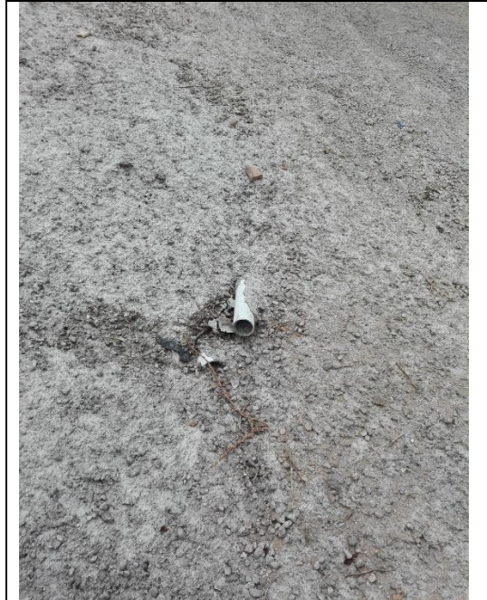
Foto 2. Se evidencia obstrucción de un dren de penetración, afectando su funcionalidad.