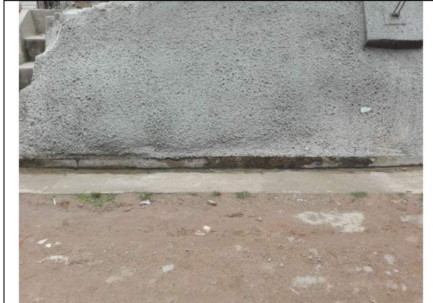
Foto 1. Se observa filtración en la parte inferior del muro de contención.